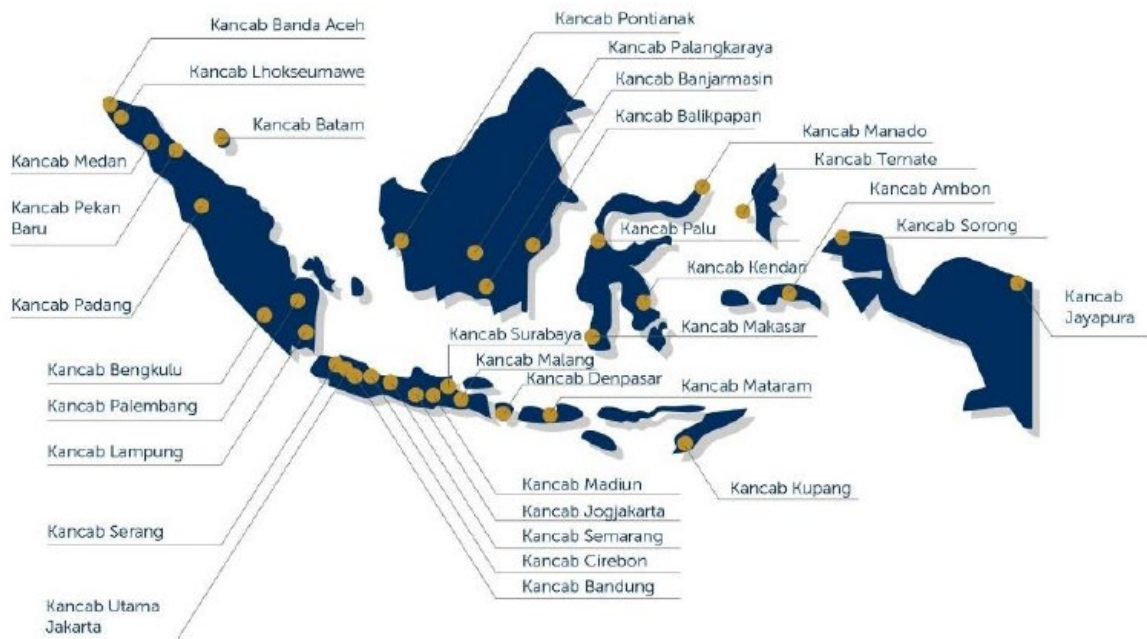
Gambar 1. 2 Sebaran Kantor Cabang PT ASABRI (Persero)